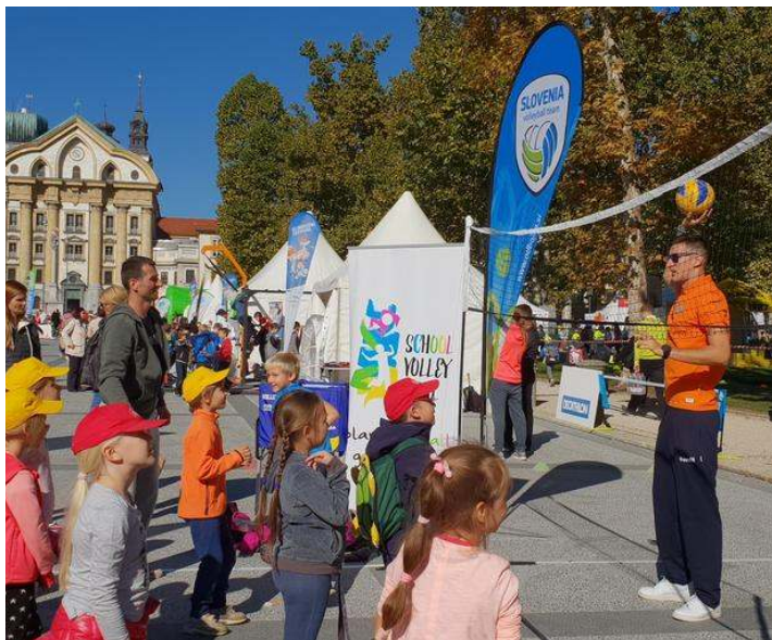
OZS je odbojko tudi v letu 2018 predstavila na obeh festivalih OKS, jesenskem in zimskem.