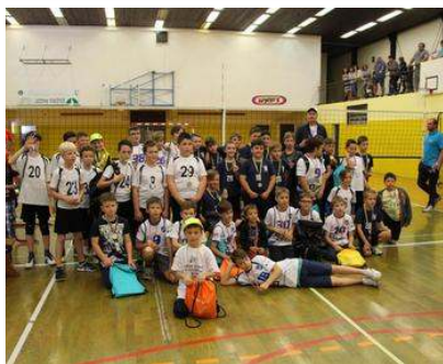
V mini odbojki je bila najboljša KekoOprema Žužemberk.