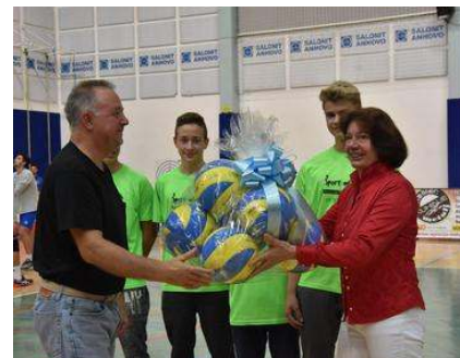
V letu 2019 bo OZS šolam namenila še vsaj 200 žog in 30 mrež.