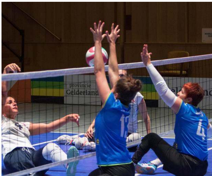
Slovenske odbojkarice so julija nastopile na svetovnem prvenstvu. Z Nizozemske so se vrnile s 13. mestom.