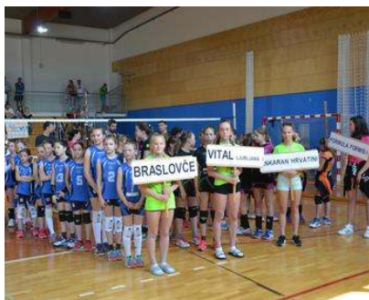
Državne prvakinja v mini odbojki so postale Braslovče.