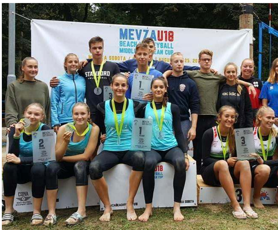
Na prvenstvu v Murski Soboti so mladi Slovenci v dveh kategorijah osvojili kar štiri odličja.