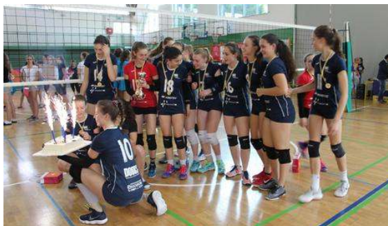
Zmagovalke mladinskega prvenstva odbojkarice Nove KBM Branik.