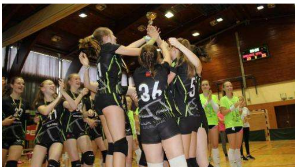
Naslova slovenskih prvakinj v mali odbojki so se veselile odbojkarice Vitala Ljubljana I.