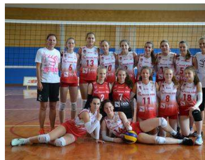
Ekipa Nova KBM Branik je slavila v kategoriji starejših deklic.