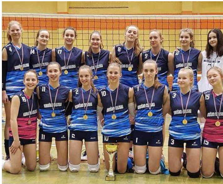
Zmagovalke Turnirja regij 2018 so postale odbojkarice koroške regije s celjsko regijo.