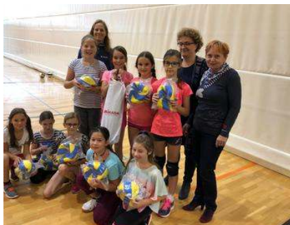
Odbojarskih žog so se razveselili na številnih osnovnih šolah po Sloveniji