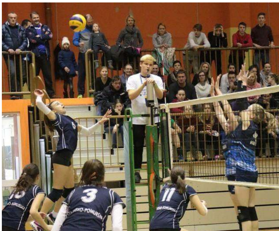
Zanimiv obračuni na Turnirju regij v Šempetru so pritegnili tudi lepo število gledalcev.

Pri fantih je drugo mesto pripadlo reprezentanci Ljubljane z okolico, v malem finalu pa so si bronasto odličje priigrali odbojkarji koroške regije s celjsko regijo, ki so se veselili zmage nad Primorci. Na 5. mestu so turnir zaključili odbojkarji mariborske regije s pomursko regijo, šesto mesto je pripadlo Gorenjcem.