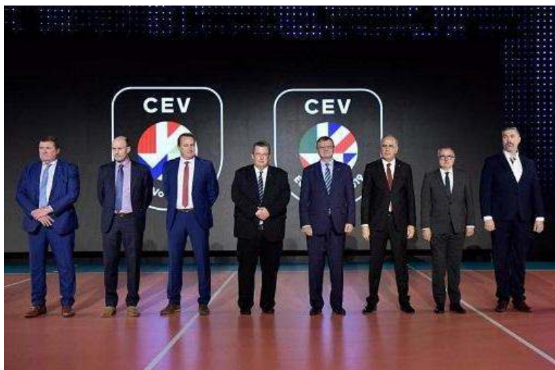
Prva uradna predstavitev organizatorjev evropskih prvenstev 2019 za moške in ženske je potekala v Budimpešti.

Naslednjem srečanju se je odvijalo 22. in 23. marca v Ljubljani, 27. in 28. aprila so sestanki in usklajevanja potekali v Bruslju, zadnjič pa so se organizacijski odbori sestali 4. oktobra v Parizu, s čimer se je najpomembnejši del priprav na Euro Volley 2019 že začel, saj je CEV predstavila prenovljeno grafično