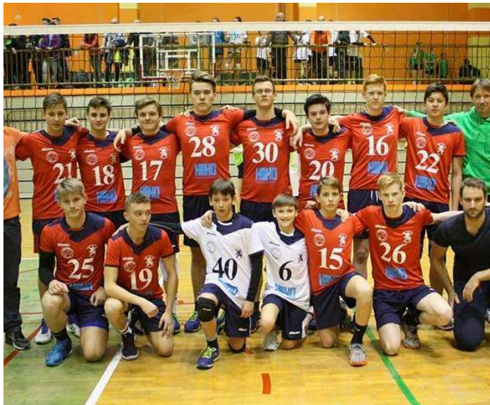
Zmage na Turnirju regij 2018 so se veselili dolenjski odbojkarji.