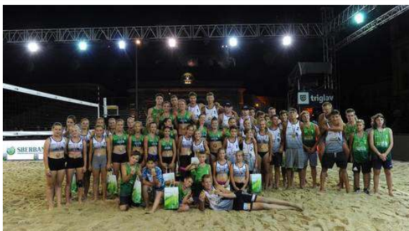
Na zaključku državnih prvenstev na Kongresnem trgu so mladi odbojkarji navdušili številne obiskovalce.