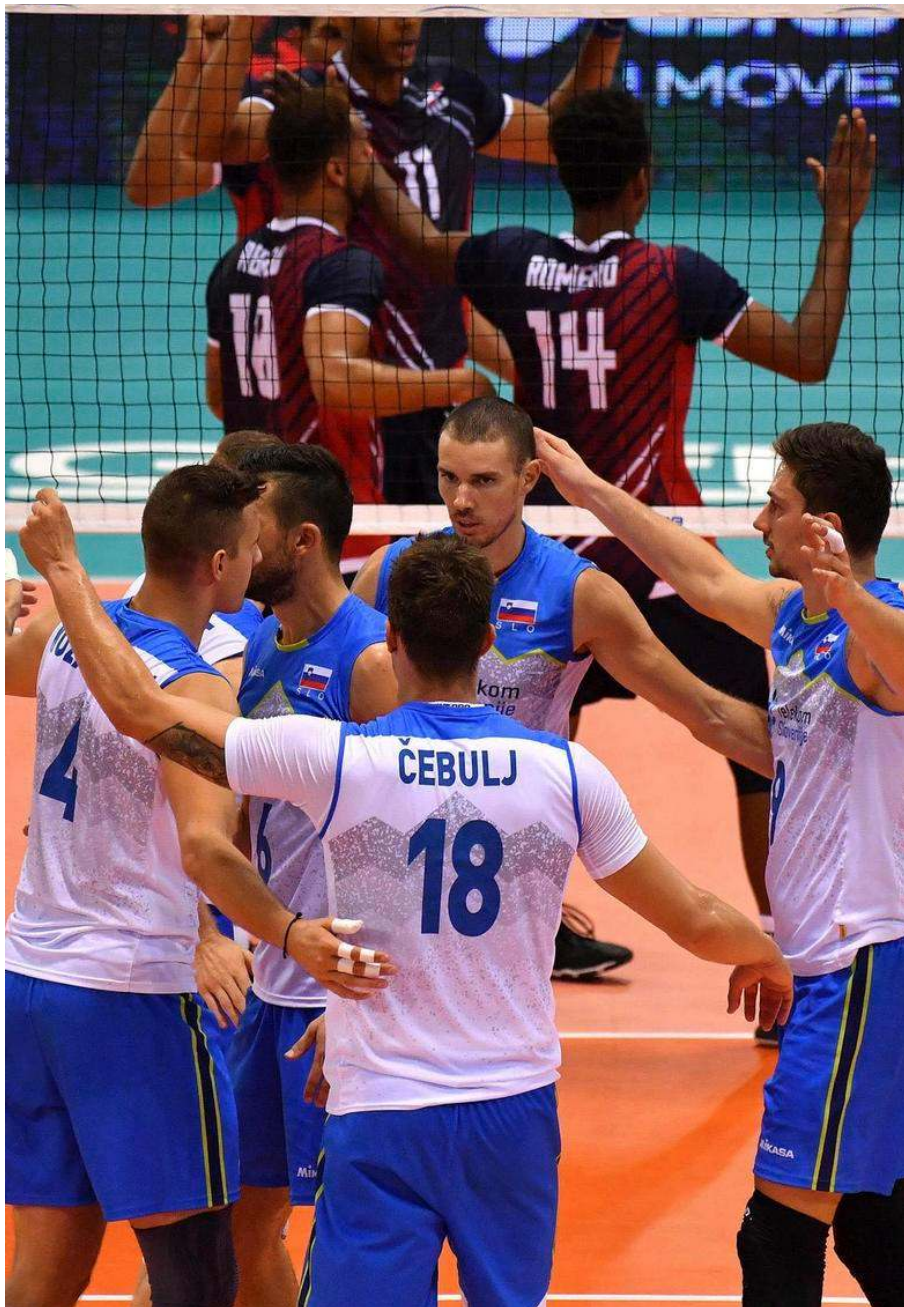
Zgodovinsko, prvo, tekmo na svetovnih prvenstvih so Slovenci odigrali proti Dominikanski republiki.

Reprezentanco je na njenem prvem svetovnem prvenstvu spremljalo lepo število slovenskih novinarjev.