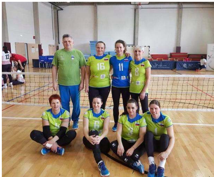
Slovenska dekleta so uspešno igrala na conskem prvenstvu na Madžarskem in osvojila 2. mesto. Boljše od naše izbrane vrste so bile le Italijanke.