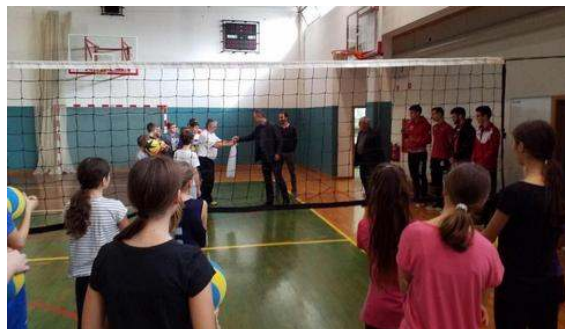
Kar trideset slovenskih šol je v dar prejelo odbojarske mreže.