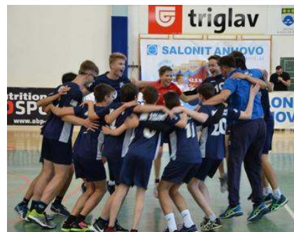
Odbojkarji Salonita Anhovo so postali državni prvaki pri starejših dečkih.