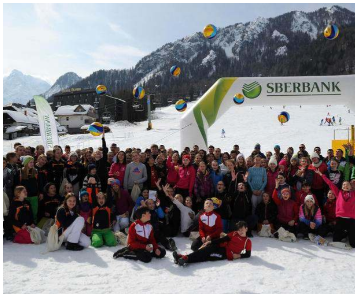
Otroci vseh starostit so lahko v Kranjski Gori brezplačno preizkusili snežno podlago in uživali v odbojki na snegu.