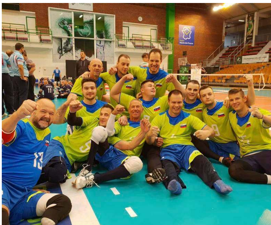
Slovenska moška reprezentanca je na conskem prvenstvu v Franciji posegla po zlategem odličju.

Moška reprezentanca je v letu 2018 izven konkurence začela nastopati v madžarskem prvenstvu.