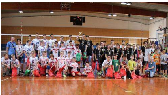
Zaključni turnir v mali odbojki so gostile Braslovče, naslova prvakov so se veselili odbojkarji Calcit Volleyja.