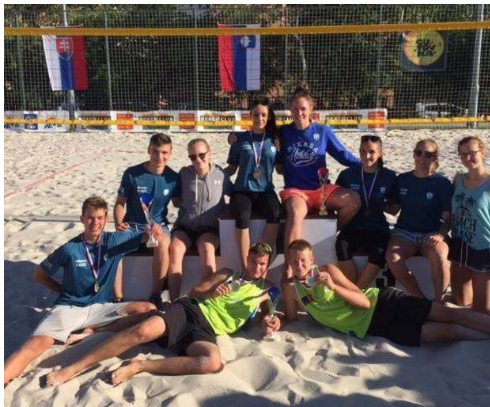
Mladi slovenski odbojkarji na mivki so uspešno nastopali na srednjeevropskih prvenstvih v vseh starostnih kategorijah.