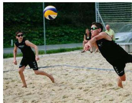
Zanimanje za turnirje za državno prvenstvo je bilo znova veliko.