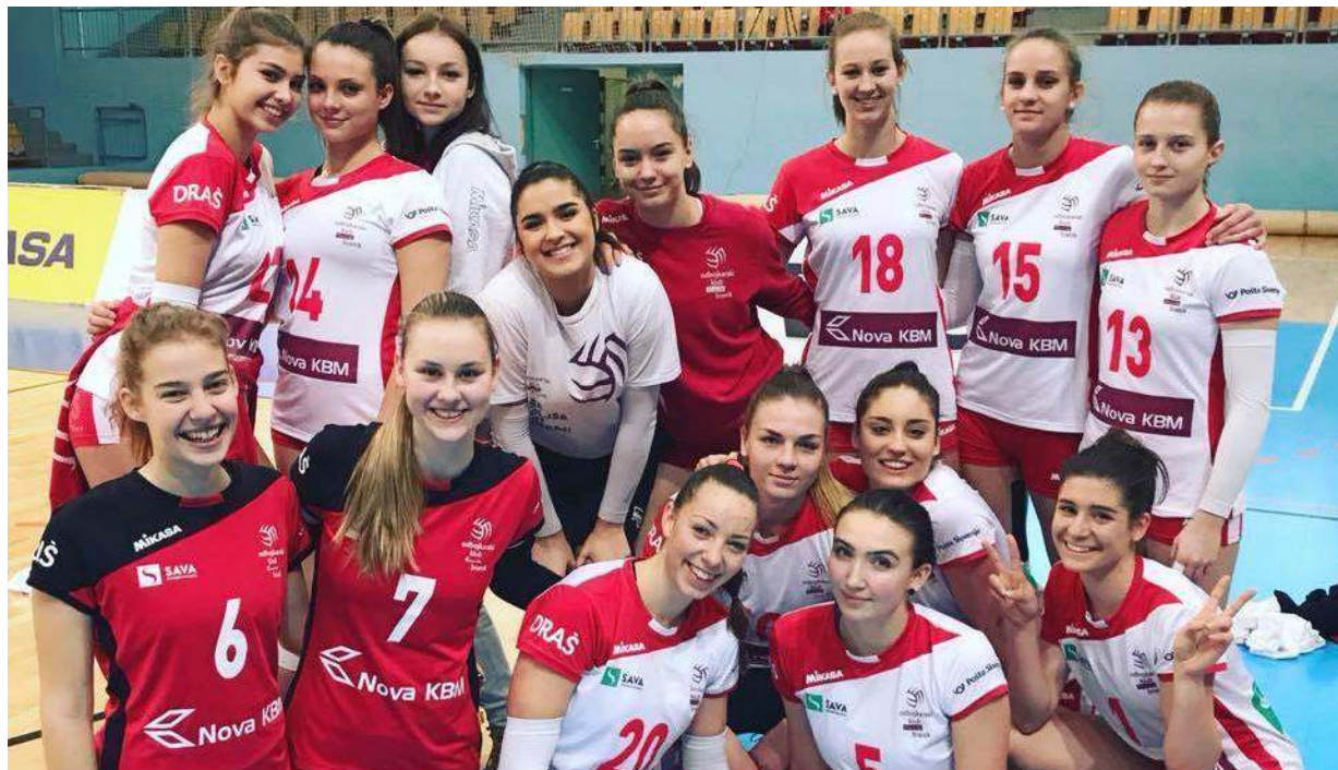
Mariborčanke so se veselile naslova mladinskih prvakinj, ki so ga prevzele iz rok preteklih zmagovalk, odbojkarice Gen-i Volleyja.