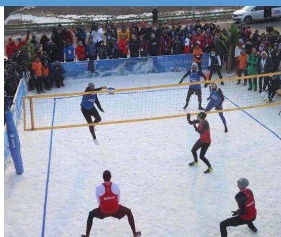
Odbojka na snegu je bila predstavljena na olimpijskih igrah v Pjongčangu, revialno tekmo pred 56 TV ekipami in več kot 300 novinarji so odigrali legendarni odbojkarji.

Odbojkarska zveza Slovenije je v Žireh organizirala prvo državno prvenstvo v odbojki na snegu, ki se ga je udeležilo osem moških in pet ženskih dvojic. Na snežni podlagi smo prvič na naših tleh tako lahko spremljali boj za državno naslova v obeh konkurencah.